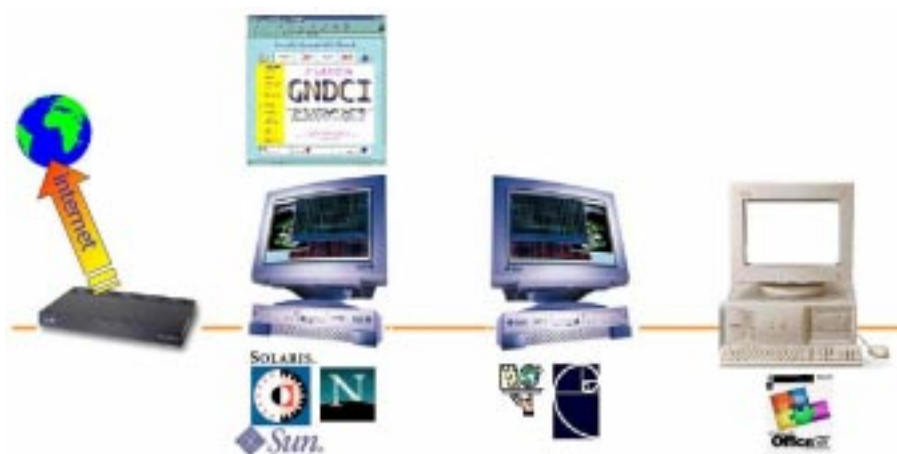
Figura 2. Schema del sistema informativo del progetto AVI.